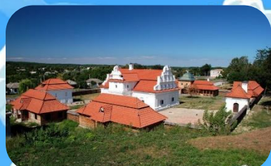
Резиденція Богдана Хмельницького