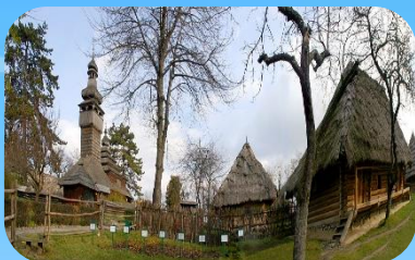
Музей народної архітектури та побуту