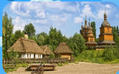
Музей Мамаєва Слобода