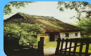
Музей Середньої Наддніпрянщини