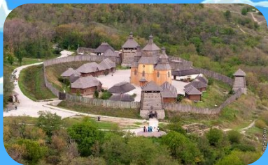
Національний заповідник «Хортиця»